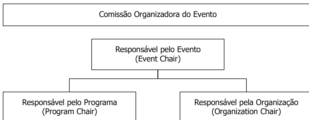
Figura 1: Organograma da Comissão Organizadora do Evento.

Deverá, ainda, ser apresentado um orçamento que reflecta a análise de informação como: